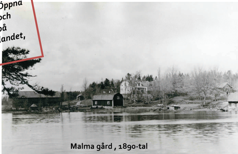
Malma gård , 1890-tal

Se artikel Öppna landskap och lantbruk på Fågelbrolandet, sid. 22