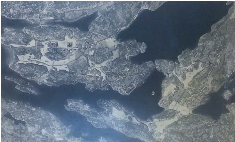
Flygfoto över Malma och Fågelbro.

För något år sedan röjdes strandängarna kring Norrviken, längs Stavsnäsvägen efter Strömman, som betesmark.