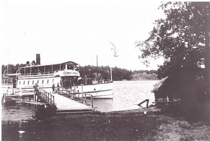
Vid Gullvikens brygga tog man "Strömma Kanal" in till Stockholm.