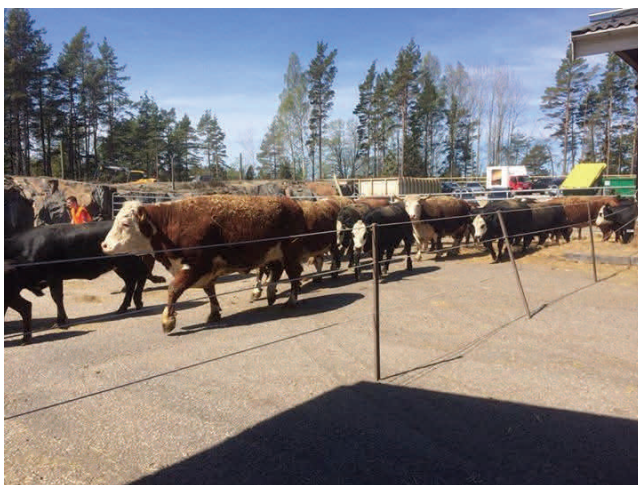
Från kosläppet 18 maj 2014.