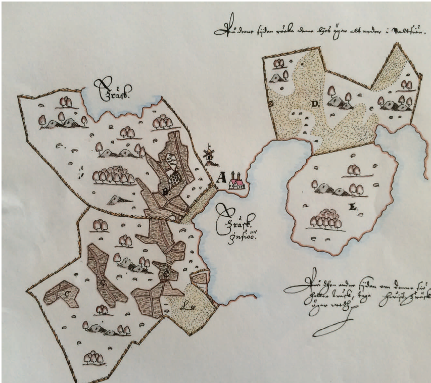
Uppeby Gård på Runmarö. Denna bild visar del av fastighetskarta (del av Koo16) över Uppeby gård på Runmarö. Markanvändningen visas med betoning på odling och bete.

Bland de nyare kartorna hittar man många av de ekonomiska kartbladen (med fastighetsgränser och -beteckningar) i skala 1:20000, en hel del sjökort från 1940- och 1950-talen, mest i skala 1:50000, samt topografiska kartor ("grönsaksblad") från 1950- och 1960-talen, också de i skala 1:50000.