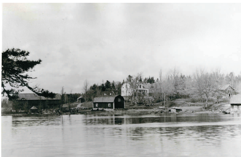
Malma gård från Storsjön. T.v. oxhus med litet hus med toppigt tak vid stranden. I mitten ett rött hus ned vid stranden kallad "Sjövillan". Bakom syns huvudbyggnaden . T.h. två mindre ekonombyggnader. I bakgrunden skymtar "Ekbacken". Foto: P.L. Quist, 1890-tal